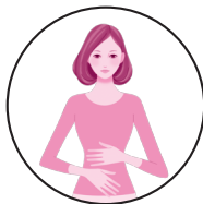
整腸 (便通を整える)