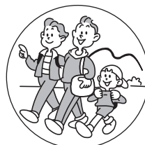
旅行など環境の変化で おなかの調子をくずしたときに