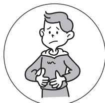
おなかの弱い方の 整腸に