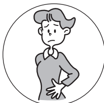
おなかが はったときに